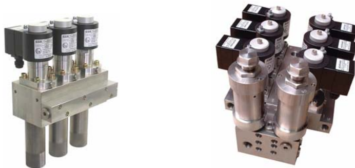
Fig. 7 : Banc de vannes triple avec filtres intégrés a), banc de vannes sextuple b)