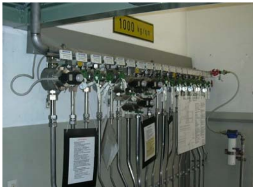
Fig. 4 : Poste de vanne chez Bayer à Uerdingen

Les contraintes et charges apparaissant à ce stade constituent les plus hautes exigences en ce qui concerne le fonctionnement, l'étanchéité et avant tout, la sécurité des électrovannes mises en œuvre ( Figures 6 ). C'est justement sur ce dernier point que la qualité de la fabrication et le choix des matériaux jouent un rôle décisif.