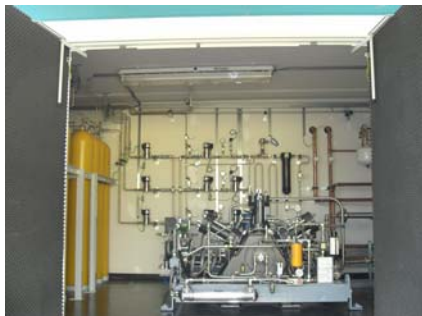
Fig. 6 : Poste de ravitaillement en gaz naturel doté de vannes haute pression GSR

Les vannes dimensionnées pour des pressions particulièrement élevées peuvent être en règle générale employées avec l'hydrogène. Pour répondre aux exigences spéciales du marché dans ce domaine, GSR Ventiltechnik développe en permanence de nouvelles solutions de vannes de qualité.