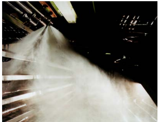
Fig. 5 : Déclenchement du système de brouillard d'eau dans un canal de câblage

Avec la technologie particulière du système RMG, le stockage de gaz naturel sous des pressions élevées, les électrovannes sont soumises à des cycles de manœuvre très fréquents. Les électrovannes doivent répondre aux mêmes exigences lors de la remise du gaz au véhicule, où les pressions différentielles peuvent en partie atteindre 200 bars et plus. Les charges en résultant posent des exigences extrêmes aux électrovannes. Comme les vannes se contentent de cycles de maintenance de plus de deux ans, les coûts d'exploitation de l'installation sont particulièrement maintenus à bas niveau.