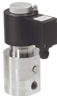
Fig. 2 : Vanne de type 2529 pour applications haute pression jusqu'à 450 bars maximum, raccord G1/8-G2

La pression du fluide ou la pression différentielle existante soulèvent le joint principal. Le fonctionnement correct des vannes n'est plus garanti si la pression différentielle baisse en dessous de la valeur minimale prescrite.