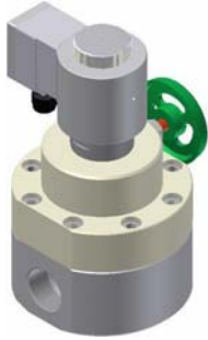
Fig. 3 : GSR type 2/040

L'exemple du canal de câblage de Bayer AG dans son établissement d'Uerdingen peut illustrer la fonction des vannes haute pression GSR dans les systèmes à brouillard d'eau.